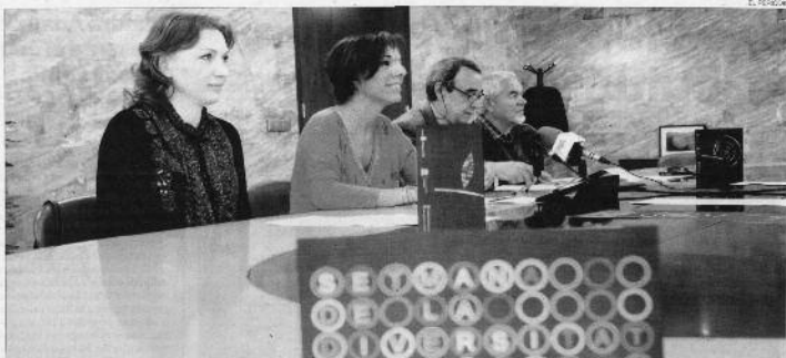
La consellera de Cultura i Participació Ciutadana del Consell d'Andorra la Vella intervé durant la roda de premsa, a l'inici.